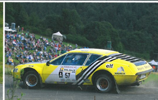
'Dauner Flugtage' - 3 Tage 'Flick-Flack' auf den Kuppen rund um Daun